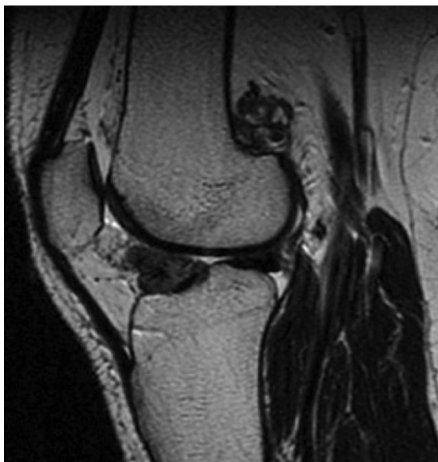
Figura 2 Imagen sagital de RM (adquisición T2) de un paciente con SVP en compartimento anterior y posterior de la rodilla (SVPD).