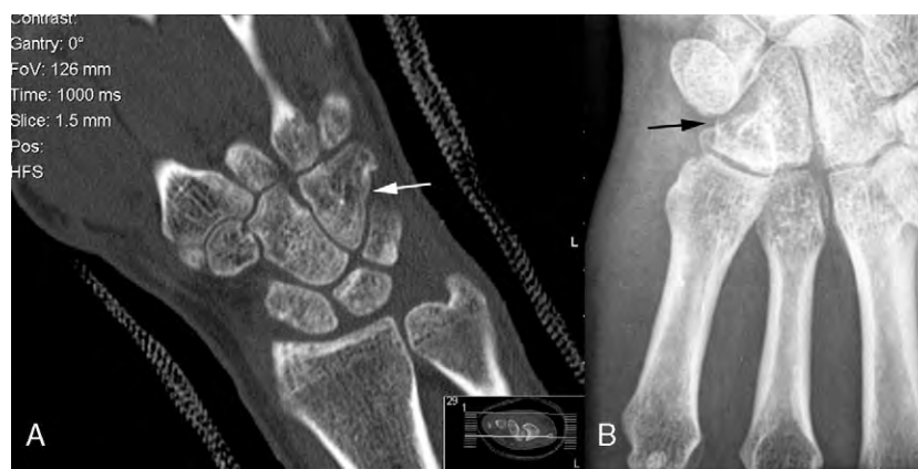
Figura 2 A) TC control a la octava semanas. B) Control Rx a las 16 semanas.

Dado el pequeño tamaño y el poco desplazamiento del fragmento óseo principal, se decidió iniciar tratamiento conservador con una férula dorsal de yeso durante una semana para control del edema.